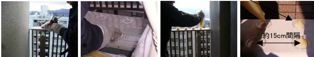
(写真は業務用パッケージです。)

PETカップは設置する場所にコーキングを打ったり両面テープなどを使用し、固定します。 写真例のように設置したPETカップに約15gの忌避剤を入れます。